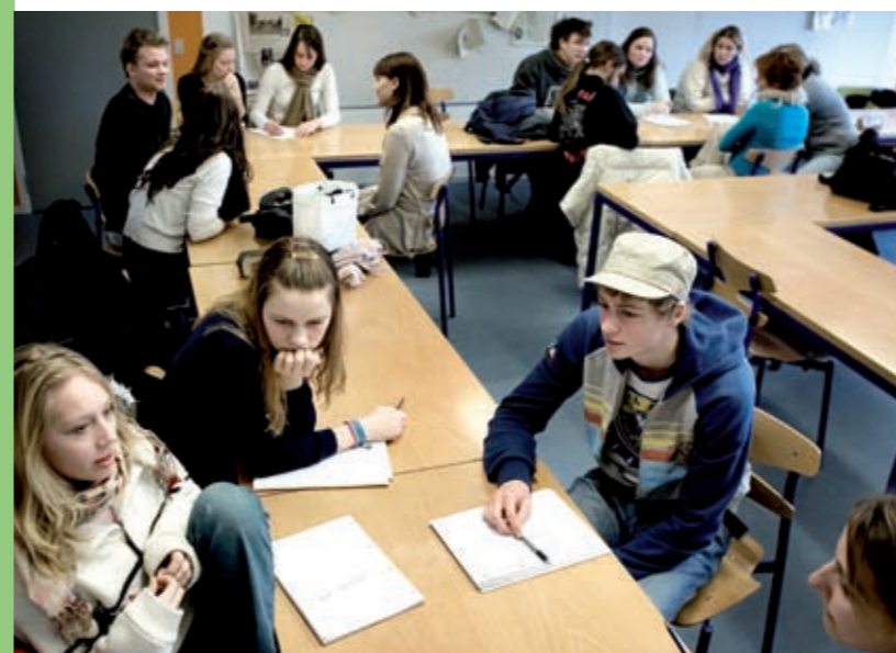
I januar 2006 diskuterede danske gymnasieelever Holocaustbenægtelse i forbindelse med Auschwitz-dagen – den danske mærkedag for Holocaust og andre folkedrab. En elev sagde bagefter: "Diskussionen om benægtelse fik mig til at tænke på, hvor forsigtig man skal være med at tro på alt, man hører eller læser."

Der er eksempler på, at nynazister sammenligner Holocaust med andre begivenheder, fx De Allieredes bombninger af tyske byer som Dresden under 2. Verdenskrig. Den slags påstande har til formål at få nazisternes forbrydelser til at virke mindre grufulde og signalere, at andre i krigen 'gjorde det samme'. Men det er en fordrejning af historien. Selvom mange civile (almindelige mennesker, der ikke deltog i krigen som soldater) mistede livet under angrebet på Dresden, kan det ikke sammenlignes med nazisternes plan om at udslutte alle jøder i hele Europa.