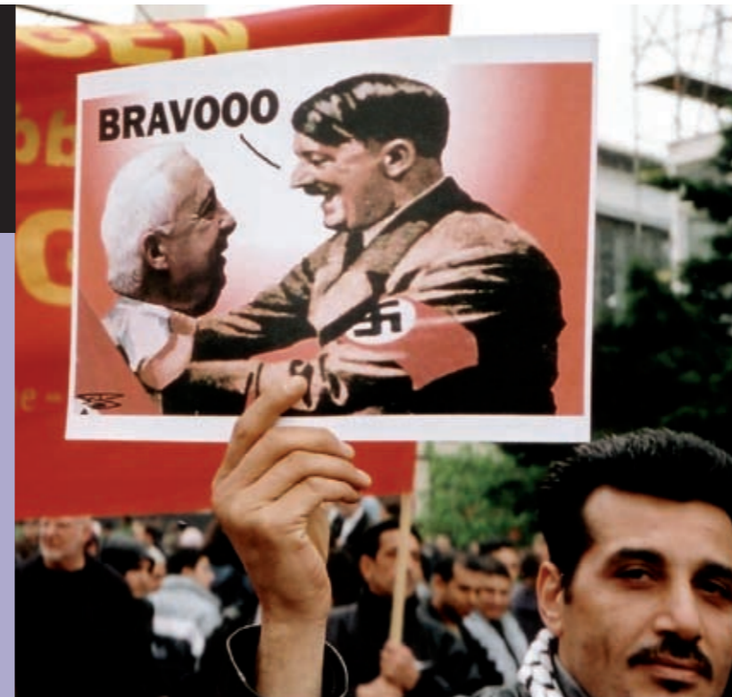
Demonstration mod Israel i Berlin, 2002. Nogle af demonstranterne sammenligner Israels og Nazitysklands politik

Hundredvis af marokkanere gik på gaden i protest mod et angreb på en jødisk bygning i hovedstaden Casablanca i 2003.