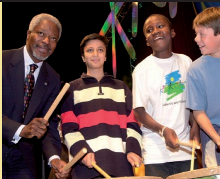
Kofi Annan, generalsekretær for FN 1997-2006, har engang sagt: "Jeg bliver opmuntret af, at flere og flere mennesker indser, at verden bliver mindre; at dit problem er mit problem, og mit problem er dit problem." På billedet ses Kofi Annan sammen med en gruppe børn ved Verdens Børn Festivalen i Schweiz, 2000.

I den tyske by Nürnberg blev 22 ledende nazister i 1945-46 retsforfulgt ved den første internationale straffedomstol. Nürnberg-domstolen skulle bl.a. dømme personer, der var ansvarlige for jødeudryddelserne under krigen. I den forbindelse opstod idéen om en permanent international domstol. Denne domstol skulle tage sig af overtrædelser af internationale regler for fx krigsførelse og af forbrydelser som folkedrab. Uenighed og magtkampe mellem USA og Sovjetunionen bremsede imidlertid