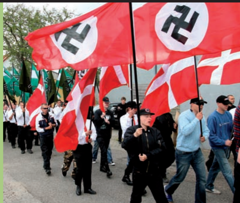
En gruppe nynazister fejrer 20-årsdagen for Rudolf Hess' død ved en mindemarch i Kolding, august 2007. Rudolf Hess var Hitlers fortrolige og indtil 1939 næstkommanderende i nazistpartiet.