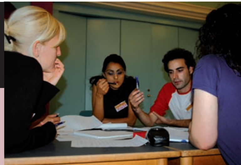
Unge jordanere, palæstinensere, jødiske og arabiske israelere mødes gennem projektet Crossing Borders.