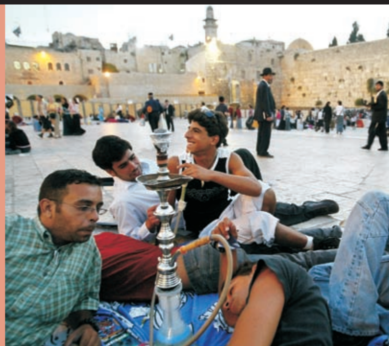
Unge israelere foran Vestmuren (også kaldet "Grædemuren") i Jerusalem.

Den antisemitisme, jøder oplevede flere steder i Europa i 1800-tallet, forstærkede ønsket om deres eget land, hvor de kunne leve i fred. De første europæiske zionister bosatte sig i Palæstina allerede i begyndelsen af 1900-tallet. De købte land fra arabiske jordejere og grundlagde jødiske samfund, der med tiden voksede sig større og større. I begyndelsen levede jøder og arabere fredeligt side om side, men med tiden førte spørgsmålet om land til splittelse. De