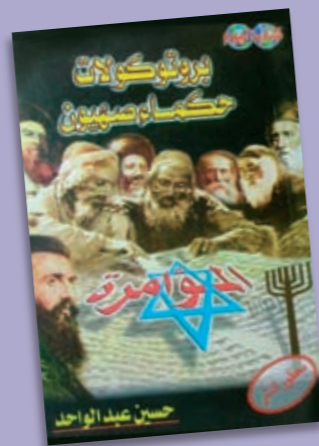
Den arabiske udgave af "Zions vises protokoller", 1976 – og den russiske fra 1922.

Ideologi er et politisk tankesæt, dvs. en 'pakke' af holdninger og idéer, der handler om, hvordan et samfund skal se ud. Eksempler på ideologier er socialisme, konservatisme, liberalisme og kommunisme. Nazisterne havde en særlig raceideologi, der inddelte mennesker i racer, som var mere eller mindre værd. Den 'ariske race' – dvs. idéen om en slags germansk herrefolk – blev anset for at være alle andre racer overlegen, og dette folk skulle derfor herske i et stort tysk rige. Den 'jødiske race' blev set som den laveste og som en trussel mod Tyskland.