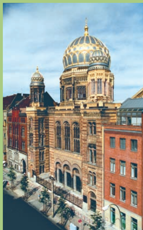
I Berlin blev denne synagoge genopbygget efter 2. Verdenskrig.

Efter Holocaust forsøgte de jødiske overlevende i Europa at begynde en ny tilværelse. Med tiden genopstod dele af den jødiske kultur, og der blev opført nye synagoger flere steder. Men jødehadet forsvandt ikke, og selv den dag i dag findes der personer og grupper med samme holdninger som Hitler. Nynazister rundt om i verden forsøger at videreføre Hitlers ideologi og betragter den 'hvide race' som overlegen. Nynazister ser ned på jøder og andre minoriteter, og nogle ønsker endda at 'rense' samfundet ved at skille sig af med minoriteterne. Nynazisterne spreder især deres ideer via internettet.